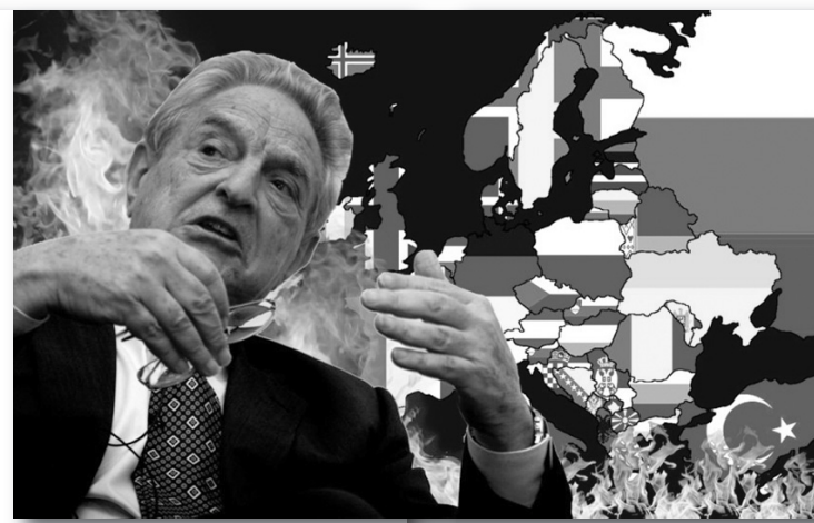
Əsas hərəkətverici mənbə kimi çıxış edirdi. Təsadüfi deyil ki, Türkiyənin "Qurdlar Vadisi" te-

Corc Soros haqqında bəhs olunan sonuncu qənaətin formalaşmasının ciddi real əsasları var. O, yaratdığı Açıq Cəmiyyət İnstitutu vasitəsilə özünə dünyada sərvətlərini xeyriyyəçiliyə, demokratik cəmiyyətlər qurulmasına yönəldən bir milyarder görünüşü yaratmağa çalışıb. Ancaq əsas sual başqadır: O, milyonlarını, necə deyirlər, ora-bura xərcləyərkən nə dərəcədə səmimi və xeyirxah olub? Açıq Cəmiyyət İnstitutunun xətti ilə müxtəlif məkanlarda reallaşdırılan layihələrə və yaxud ssenarilərə nəzər saldıqda aydın olur ki, ortada səmimiyyət və humanizm ümumiyyətlə, yoxdur, söhbət sadəcə, güc mərkəzlərinin diktesindən, cəmiyyətlərə ötürülən siyasi sifarişlərdən və maraqlardan gedir. Bir neçə il bundan əvvəl Yaxın Şərqdə başlayan və hazırda da ayrı-ayrı ölkələrdə davam edən rəngli inqilabları, "Ərəb baharı" nı xatırlayaq. Bu inqilabların sosial sifarişləri cəmiyyətlərdən gəlmirdi. Bunlar imperialist güc mərkəzlərinin mətbəxlərində hazırlanan məkrli planların tərkib hissələri idi. Belə ssenarilərin reallaşmasında Açıq Cəmiyyət İnstitutunun, C.Sorosun vəsaitləri